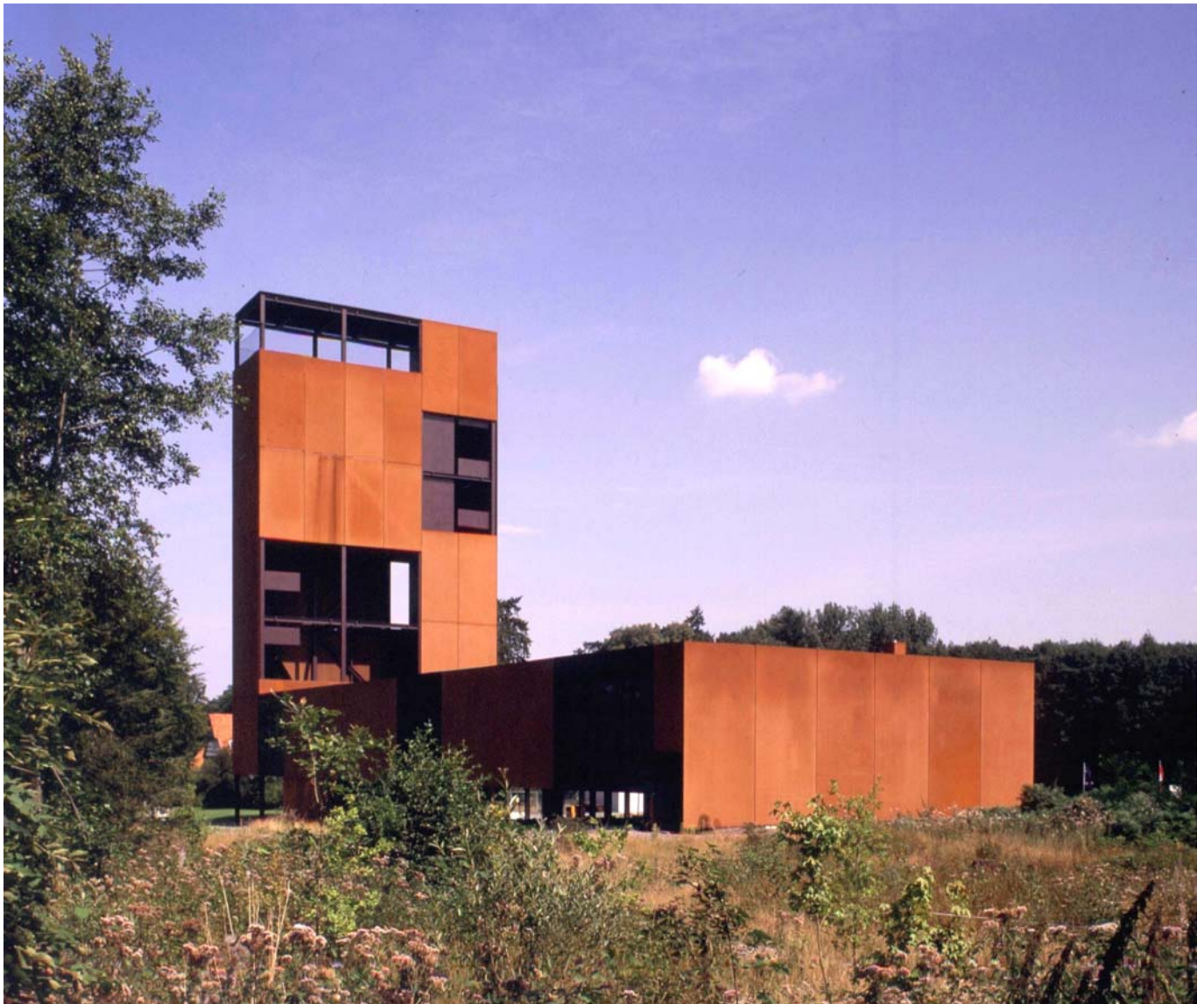
An einem Schlachtfeld der Zeitenwende: Museumsgebäude in Kalkriese

Der Landkreis Osnabrück gehört zu den Kreisen mit starker Bevölkerungszunahme sowohl in absoluter als auch in relativer Hinsicht. Zwischen 1970 und 2004 ist die Einwohnerzahl des Kreises um über 87 000 Personen gewachsen, nur die Landkreise Hannover (inzwischen Teil der Region Hannover; 105 800) und Harburg (80 400) verzeichneten noch höhere Werte. Auch das relative Wachstum von 29,1 % darf als beträchtlich bezeichnet werden. Dazu leistet die natürliche Bevölkerungsentwicklung mit einem Positivsaldo von 16 200 mehr Geburten als Sterbefällen nur einen kleinen Beitrag. Die wichtigste Komponente sind Wanderungsgewinne in Höhe von insgesamt 70 900 Personen, die nur zu einem geringen Teil aus dem Zuzug von Osnabrückern, ganz überwiegend aber aus der Zuwande-