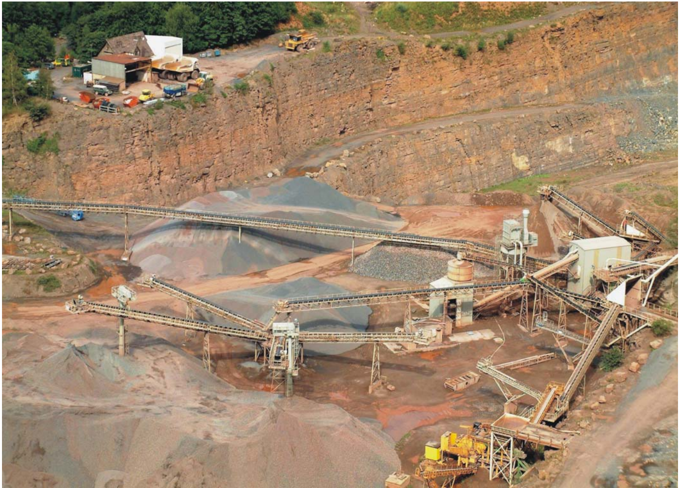
Natursteingewinnung – hier nahe Steinbergen im Landkreis Schaumburg –, ein Wirtschaftszweig mit Tradition, aber oft unsicherer Zukunft

cken der Rehburger Eisrandlage. Sie zieht sich vom Kellenberg bei Diepholz über die Uchter Böhnde und die Nienburg-Neustädter Geest bis zu den Mellendorfer und Brelinger Bergen nördlich von Hannover quer durch das Bezirksgebiet. Noch bis in das vorige Jahrhundert hinein waren diese Standorte mit ihren armen Podsolböden nahezu gänzlich verheidet. Heute stocken hier Kiefern- und Fichtenforsten. Im Gegensatz zur Geest mit ihren Einzelwäldern und Feldgehölzen dominieren im Bergland große geschlossene Waldungen, die die steinigen lössfreien Hänge und Kuppen der Festgesteinsrücken einnehmen. Auf den Sandsteinrücken des Sollings, Voglers, Hils und anderer Bergzüge wachsen überwiegend Fichtenbestände, während auf den Kalksteinhöhen Buchen vorherrschen, die einst Grundlage der Möbelindustrie waren.