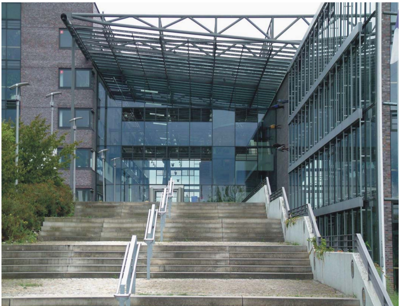
Im „Speckgürtel“ der Landeshauptstadt wurden aus Dörfern in wenigen Jahrzehnten Städte: das neue Rathaus Garbsen

Bedeutendster industrieller Wirtschaftszweig ist der Fahrzeugsektor, die Wachstumsbranche Automotive. Allein in Hannover sind ca. 30 000 Arbeitsplätze in diesem Bereich vorhanden, etwa die Hälfte davon im zweitgrößten Volkswagenwerk Deutschlands (VW Nutzfahrzeuge). Nicht nur die Produktion unterliegt hier ständig innovativen Anpassungsprozessen, auch Forschungseinrichtungen und die beteiligten Unternehmen entwickeln immer neue, mit der Automobilnutzung verbundene Handlungsfelder (Entwicklung neuer Materialien, Verkehrsleitsysteme oder Park-and-ride-Konzepte, Perfektionierung des Automobilrecyclings). Global agierende Systemzulieferer wie Continental und Wabco sind beispielsweise mit der Entwicklung eines neuartigen