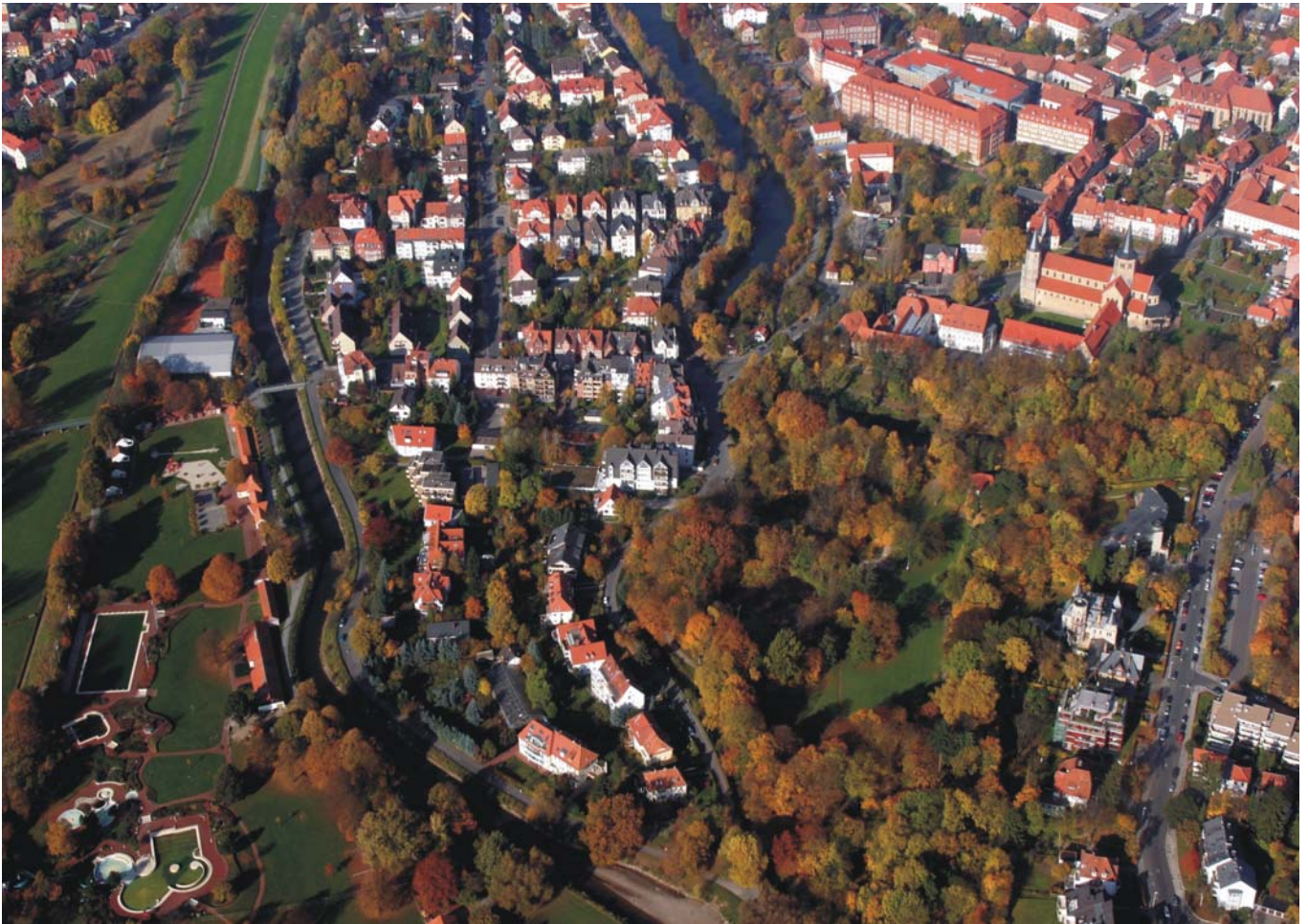
Innenstadtnahes Wohnen im Grünen: Hildesheim zwischen Innerste, Kalenberger Graben und St. Godehard Kirche

– insbesondere B 3, B 6, B 65, B 217 oder B 441 – erschließen die Autobahnen heute aber fast alle Teile des Bezirks, sodass die infrastrukturelle Ausstattung einer der wichtigsten Standortvorteile ist.