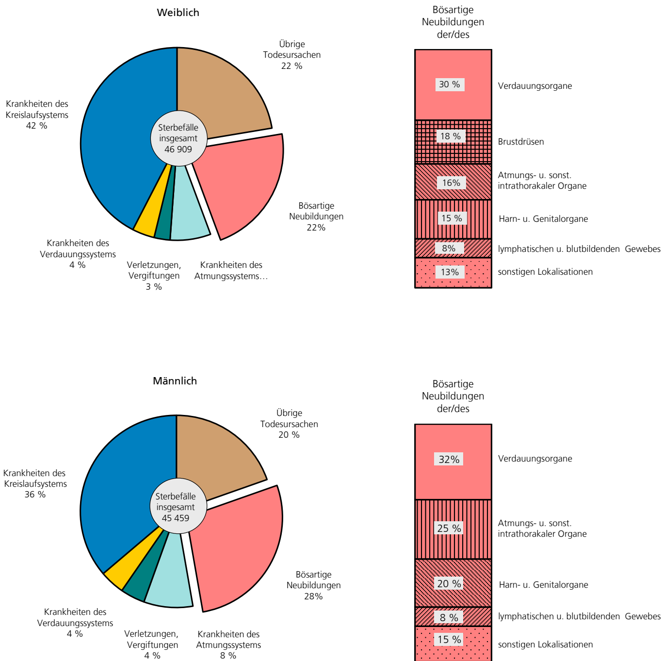
Abbildung 1: Gestorbene 2016 nach Todesursachen und Geschlecht