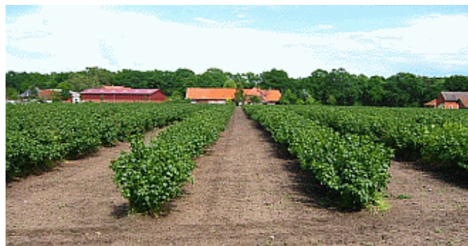
Schwarze Johannisbeeren bei Leese

Unerwarteten hohe Ernteausschläge gab es bei den schwarzen Johannisbeeren, die vor allem im Raum Leese (Kreis Nienburg) zur Safterzeugung angebaut werden. Bei manchen Schlägen lohnte sich die Ernte nicht, da die Erntekosten die Erträge überstiegen hätten. Die Ausfälle zeigten sich erst mit der Fruchtbildung, da die Blüte, die Befruchtung und die Belaubung keinen Anlass zum Pessimismus gaben. Als Ursachen für diese Ausfälle wird neben Sortenanfälligkeiten hauptsächlich die extreme Trockenheit im letzten Jahr vermutet. Trotz der vielen leichten Böden um Leese wird dort nicht beregnet. Die Sträucher verloren 2003 früh das Laub und konnten so die Knospen für 2004 nicht gut ausbilden. Es gab ausnahmsweise auf einzelnen Schlägen auch Erträge um 40 dt/ha, eher bei späten Sorten und sehr guten Standorten, aber in der Mehrzahl der Anlagen war diese Ernte für die Anbauer leider ein Rückschlag.