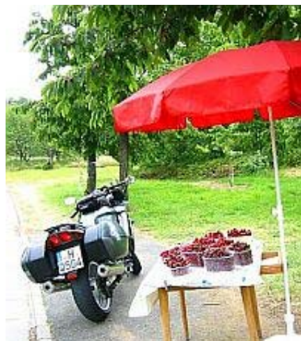
26.06.04: Kirschenverkauf ab Plantage

* ab 2003 in der Ernteschätzung. Die noch vorwiegend sehr jungen Bäume kommen erst in das Vollertragsalter.